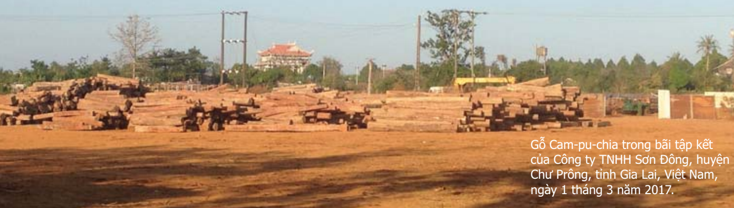
Gỗ Cam-pu-chia trong bãi tập kết của Công ty TNHH Sơn Đông, huyện Chư Prông, tỉnh Gia Lai, Việt Nam, ngày 1 tháng 3 năm 2017.

Sự tiếp tay của chính quyền cho tội phạm buôn lậu gỗ có tổ chức xuyên quốc gia trị giá hàng triệu USD không thể được chấp nhận bởi cộng đồng quốc tế và càng không được phép bỏ qua bởi EU.