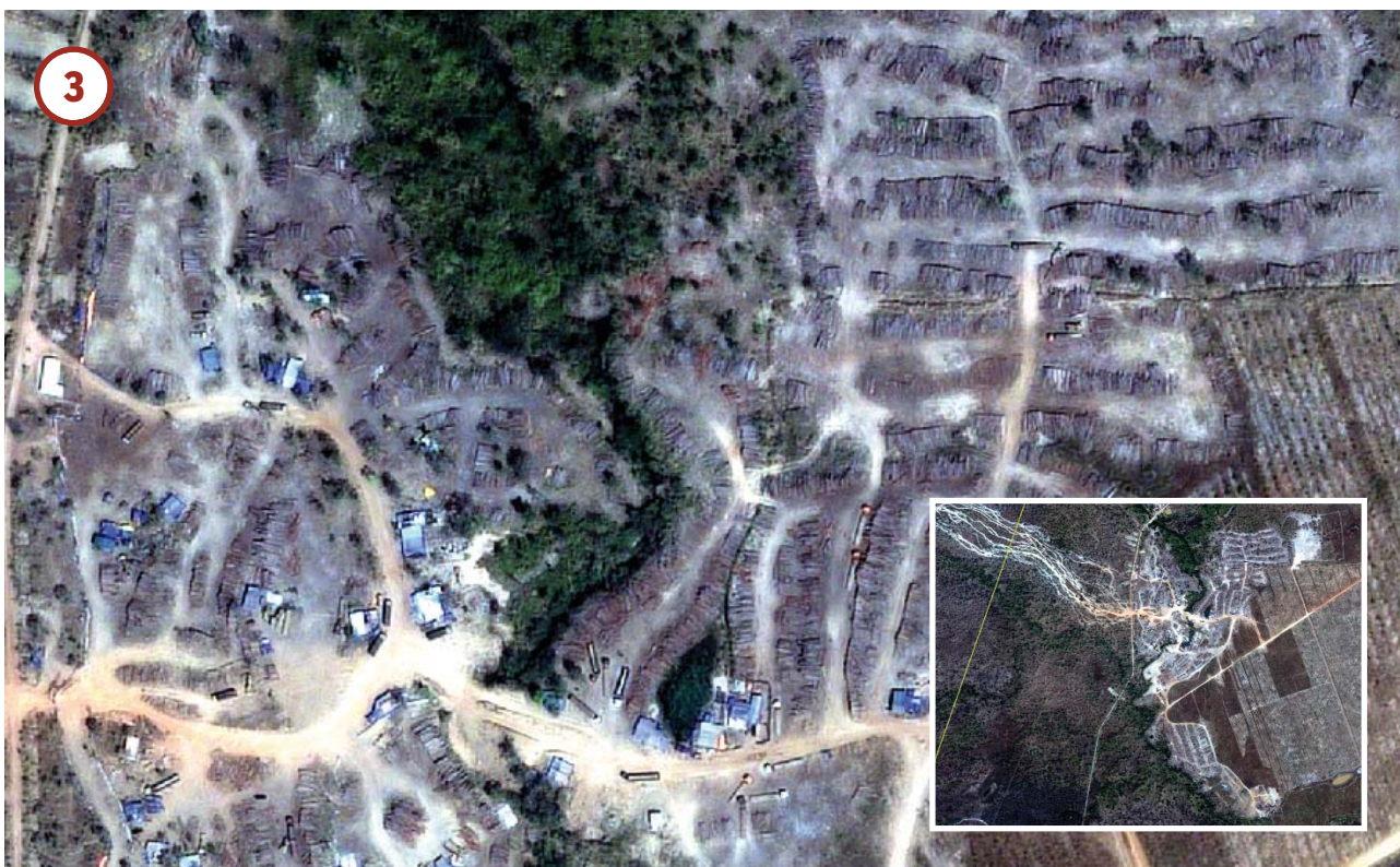
Ngày 6 Tháng 2 năm 2017