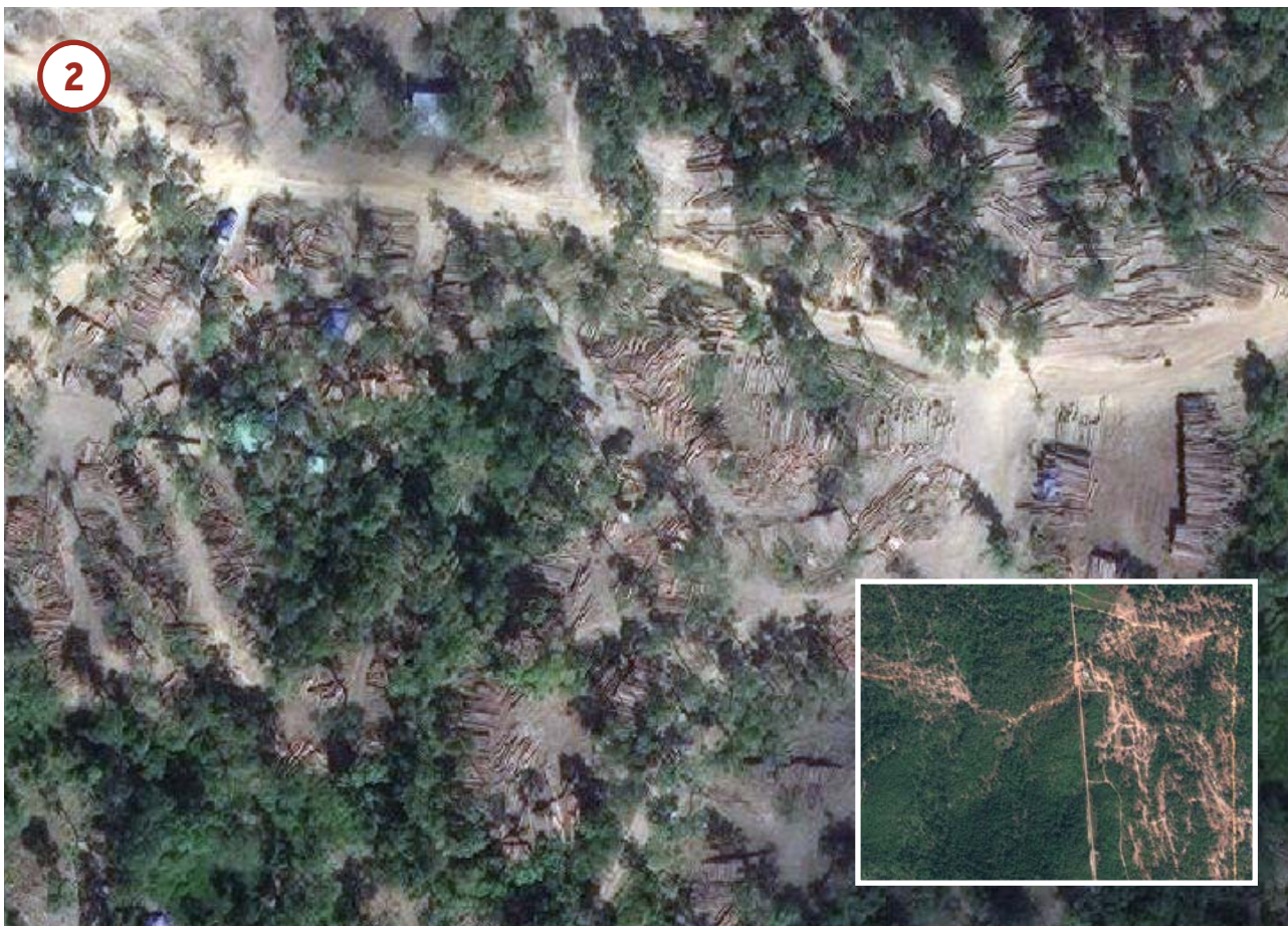
Ngày 7 tháng 1 năm 2017