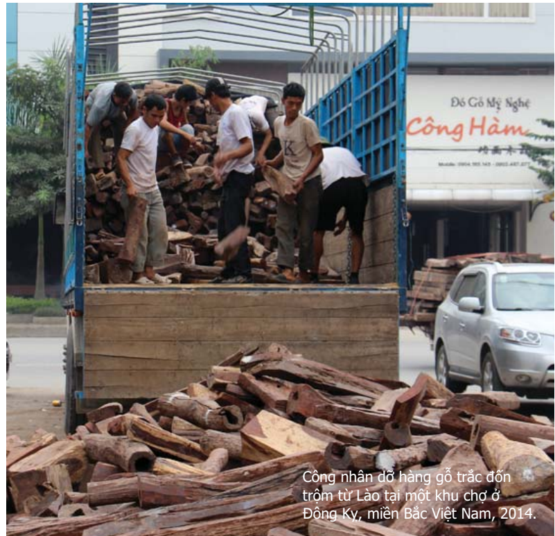
Công nhân dỡ hàng gỗ trặc đốn trộm từ Lào tại một khu chợ ở Đông Ky, miền Bắc Việt Nam, 2014.

Trong năm 2015, Việt Nam nhập 590.000 m 3 (tính theo tương đương gỗ tròn) gỗ tròn và gỗ xẻ từ Cam-pu-chia, tăng 800% so với lượng nhập khẩu năm 2013. Riêng nhập khẩu gỗ tròn tăng từ chỉ 383 m 3 vào năm 2014 lên đến 57.700 m 3 vào năm 2015, bắt chập việc Cam-pu-chia đã cấm xuất khẩu gỗ tròn.