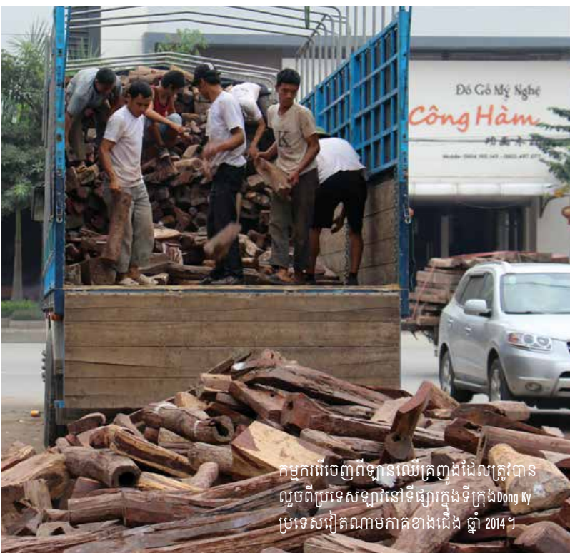
កម្មកររឹចេញពីឡានឈើត្រព្យងដែលត្រូវបានលួចពីប្រទេសឡាវនៅទីផ្សារក្រុងទីក្រុង Dong Ky ប្រទេសវៀតណាមភាគខាងជើង ឆ្នាំ 2014 ។

ក្នុងឆ្នាំ 2015 ប្រទេសវៀតណាមបាននាំចូល 590 000 ម 3 នៃកំណាត់ឈើ (ដែលជាឈើសមមូលទៅនឹងកំណាត់ឈើមូល) និងឈើអារូចពីប្រទេសកម្ពុជា ដែលជាក់នើន ដ៏សម្បើមស្មើនឹង 800 ភាគរយធៀបទៅនឹងការនាំចូលក្នុងឆ្នាំ 2013 ។ ការនាំចូល កំណាត់ឈើតែងបានកើនឡើងពីត្រីមតែ 383 ម 3 ក្នុងឆ្នាំ 2014 រហូតដល់ 57 700 ម 3 នៅក្នុងឆ្នាំ 2015 ថ្មីបីមានបម្រាមហាមឃាត់ ការនាំចេញកំណាត់ឈើទៅរបស់កម្ពុជាក៏ដោយ ។