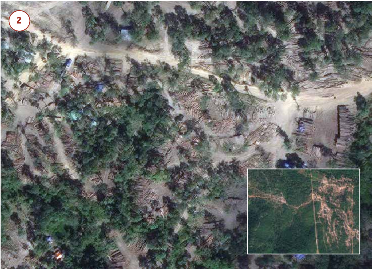
ថ្ងៃទី 7 មករា ឆ្នាំ 2017