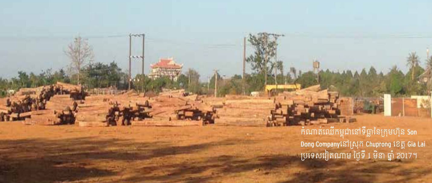
កំណាត់ឈើកម្ពុជានៅទីធ្លានៃក្រុមហ៊ុន Son Dong Company នៅស្រុក Chuprong ខេត្ត Gia Lai ប្រទេសវៀតណាម ថ្ងៃទី 1 មិនា ឆ្នាំ 2017។

ការចូលរួមពាក់ព័ន្ធរបស់រដ្ឋនៅក្នុងបទល្មើសឈើឆ្លងប្រទេសដែលមានការរៀបចំទុកដែលមានតម្លៃច្រើនលានដុល្លារអាមេរិកមិនអាចទទួលយកបានដោយសហគមន៍អន្តរជាតិឡើយហើយមិនត្រូវបានទុកចោលមិនអីពីដោយ EU បានឡើយ។