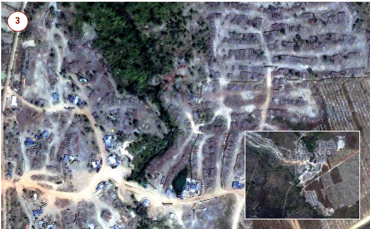
ថ្ងៃទី 6 កុម្ភៈ ឆ្នាំ 2017