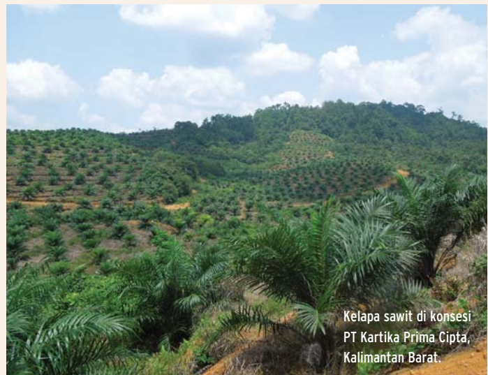
Kelapa sawit di konsesi PT Kartika Prima Cipta, Kalimantan Barat.

FPP mengajukan keluhan terhadap PT Mutuagung Lestari pada bulan Oktober 2014. Pada saat penulisan laporan ini (lebih dari satu tahun setelahnya), keluhan tersebut belum ditanggapi oleh ASI dan RSPO karena kegagalan untuk menentukan prosedur yang benar untuk diikuti dan tindak lanjut yang lambat oleh Sekertariat RSPO.