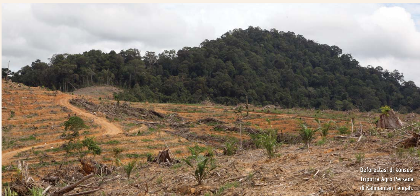
Deforestasi di konsesi Triputra Agro Persada di Kalimantan Tengah.