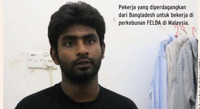
Pekerja yang diperdagangkan dari Bangladesh untuk bekerja di perkebunan FELDA di Malaysia.