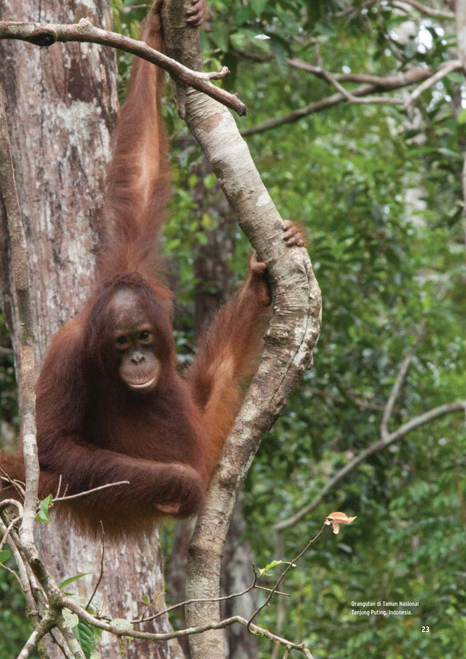
Orangutan di Taman Nasional Tanjung Puting, Indonesia.