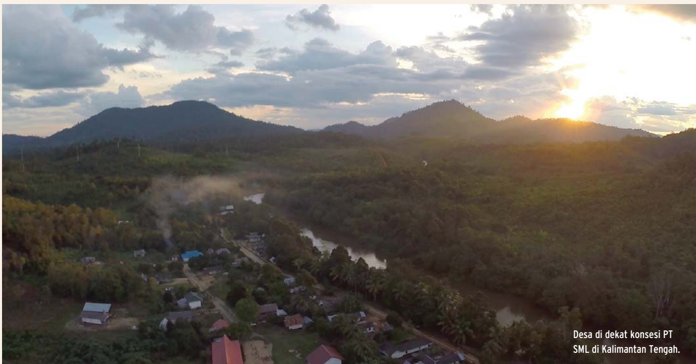
Desa di dekat konsesi PT SML di Kalimantan Tengah.

Dikarenakan tekanan dari para pembeli utamanya, 37 PT SML kemudian menugaskan suatu "asesmen orang-utan secara komprehensif" agar dilaksanakan oleh lembaga konservasi yang terpercaya. Hal ini menciptakan suatu prospek bahwa PT SML menyadari bahwa asesmen NKT-nya gagal untuk sepenuhnya dan secara akurat mengidentifikasi habitat orang-utan. PT SSS memberikan konfirmasi kepada EIA bahwa survei tersebut akan "diakomodasi dalam rencana tata ruang", 38 meskipun asesmen NKT-nya masih dijadikan dasar bagi pembukaan wilayah tersebut.