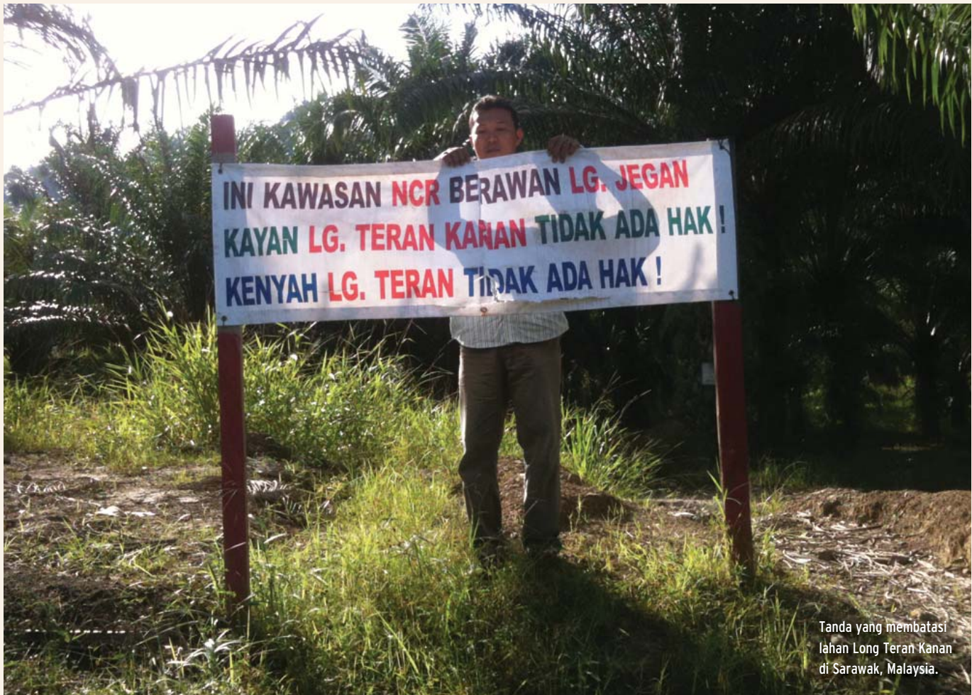
Tanda yang membatasi lahan Long Teran Kanan di Sarawak, Malaysia.