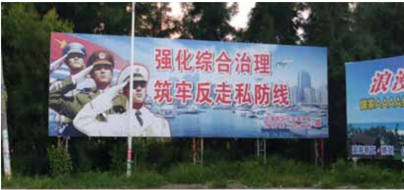
上图： 在水东邻近市镇博贺见到的 广告牌。