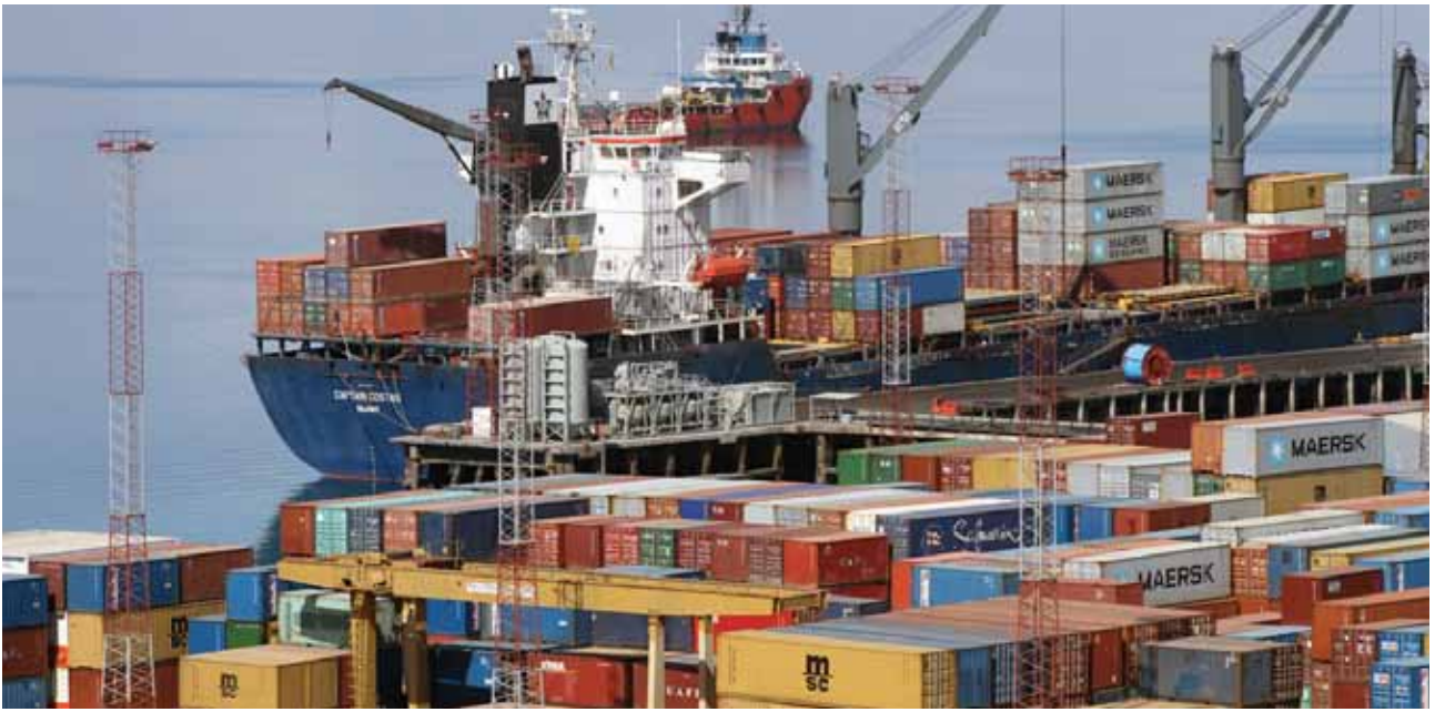
上图： 2012年，莫桑比克彭巴港口。