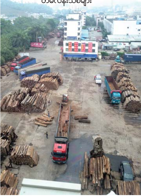
ရှန်ဇန် ဝှမ်လန်ဈေးရှိ တန်ဖိုးကြီး တမလန်းသစ်များ