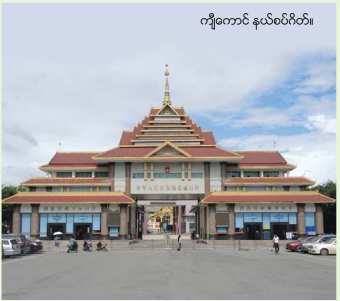
ကျီကောင် နယ်စပ်ဂိတ်။