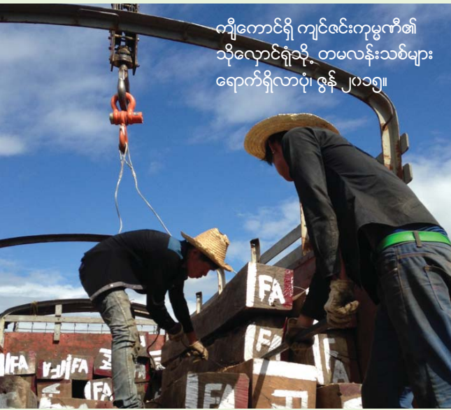
ကျီကောင်ရှိ ကျင်လင်းကုမ္ပဏီ၏ သို့လှောင်ရုံသို့ တမလန်းသစ်များ ရောက်ရှိလာပုံ၊ ဇွန် ၂၀၁၅။

တရုတ်အကောက်ခွန်အချက်လက်များအရကျင်လင်းသည် ၂၀၁၄အတွင်းမြန်မာနိုင်ငံမှတမလန်းသစ်အတင်သွင်းဆုံးကုမ္ပဏီဖြစ်ပြီးတန်ချိန် ၃၄၂၇၄ တန်တင်သွင်းခဲ့သည်ဟုဆိုသည်။ ၁၀