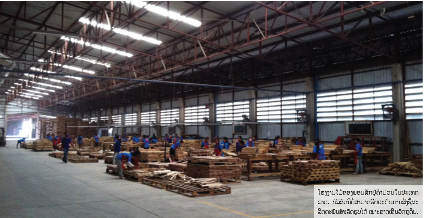
ໂຮງງານໄມ້ຂອງພອນສັກຢູ່ຄຳມ່ວນໃນປະເທດລາວ. ບໍລິສັດນີ້ບໍ່ສາມາດຮັບປະກັນການສັ່ງຊື້ຜະລິດຕະພັນສຳເລັດຮູບໄດ້ ເພາະຂາດເຂີນວັດຖຸດິບ.