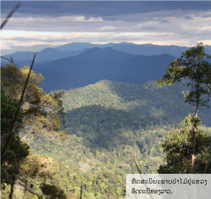
ຫັດສະນີຍະພາບປ່າໄມ້ຢູ່ແຂວງອັດຕະປືຂອງລາວ.

ສ່ວນຫລາຍການຄ້າໄມ້ນີ້ເກີດຈາກຄວາມຕ້ອງການວັດຖຸດິບຢູ່ໃນປະເທດເພື່ອນບ້ານ ໂດຍສະເພາະແມ່ນຫວຽດນາມ. ຄວາມລົ້ມເຫລວໃນການເກືອດຫ້າມການສົ່ງໄມ້ທ່ອນອອກນອກປະເທດນັ້ນ ເຮັດໃຫ້ຂາດເຂີນໄມ້ທີ່ຈະປ້ອນໃຫ້ແກ່ອຸດສາຫະກໍາປຸງແຕ່ງໄມ້ຂອງລາວ. ໃນເດືອນກຸມພາ ປີ 2011 ໂຄສິກາຟິນິເຈີໄມ້ລາວຈົມວ່າ ການຂາດເຂີນວັດຖຸດິບມີຜົນກະທົບຕໍ່ກໍາໄລຂອງອຸດສາຫະກໍາຟິນິເຈີ ແລະເຮັດໃຫ້ມີການຍົກເລີກການສົ່ງຊື້ຈາກນອກປະເທດ. ໂຄສິກາຜູ້ນີ້ຮຽກຮ້ອງໃຫ້ລັດຖະບານ