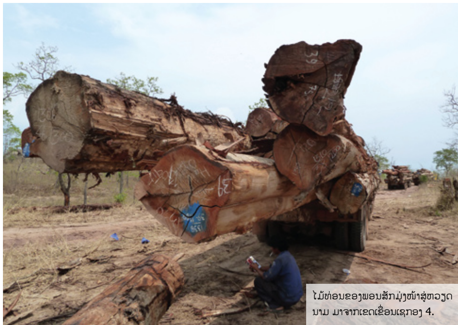
ໄມ້ທ່ອນຂອງພອນສັກມຸ່ງໜ້າສູ່ຫວຽດນາມ ມາຈາກເຂດເຂື່ອນເຊກອງ 4.