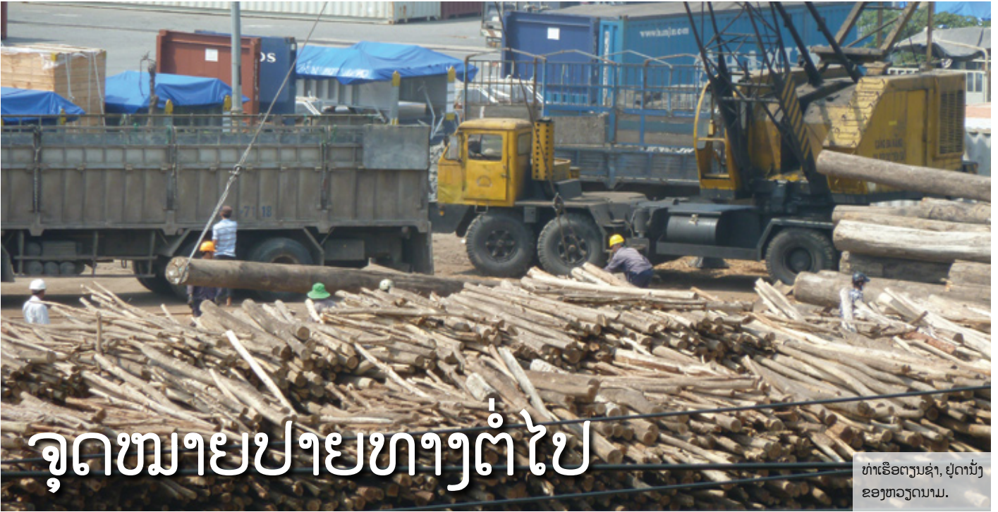
ທ່າເຮືອຕຽນຊ່າ, ຢູ່ດານັ່ງຂອງຫວຽດນາມ.