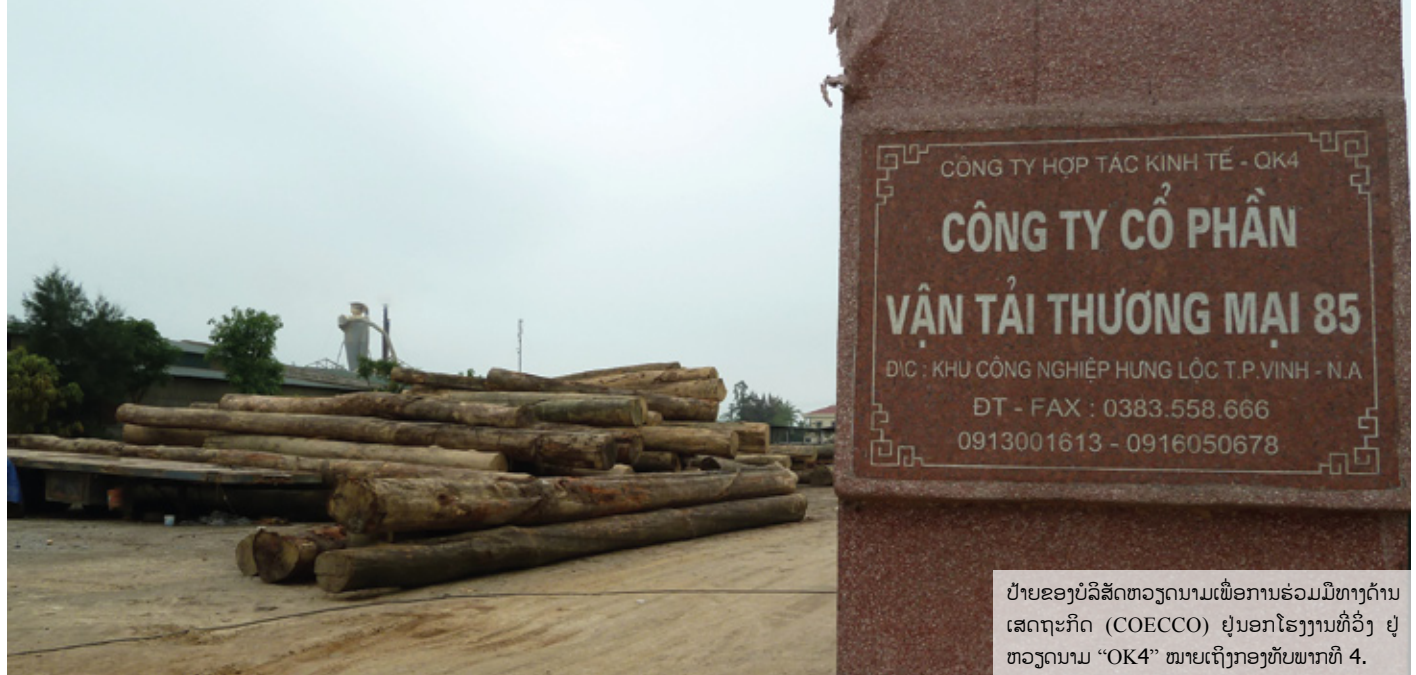
ປ້າຍຂອງບໍລິສັດຫວຽດນາມເພື່ອການຮ່ວມມືທາງດ້ານເສດຖະກິດ (COECCO) ຢູ່ນອກໂຮງງານທີ່ວິງ ຢູ່ຫວຽດນາມ “OK4” ໝາຍເຖິງກອງທັບພາກທີ 4.