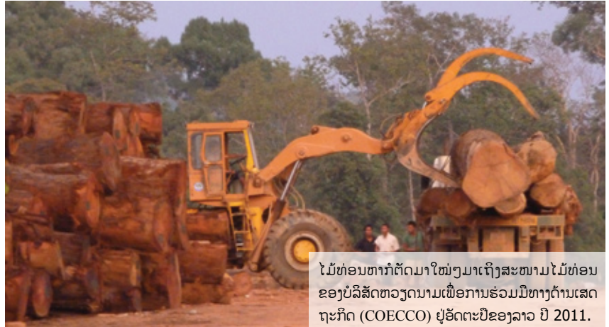
ໄມ້ທ່ອນຫາກໍ່ຕັດມາໃໝ່ໆມາເຖິງສະໜາມໄມ້ທ່ອນຂອງບໍລິສັດຫວຽດນາມເພື່ອການຮ່ວມມືທາງດ້ານເສດຖະກິດ (COECCO) ຢູ່ອັດຕະປືຂອງລາວ ປີ 2011.

ໜ່ວຍທຸລະກິດຂອງຜູ້ບັນຊາການກອງທັບຫວຽດນາມພາກທີ 4 ຊຶ່ງຫ້ອງການໃຫຍ່ຂອງທັງສອງອົງການນີ້ຕັ້ງຢູ່ນະຄອນວິງແລະໄດ້ຜົນປະໂຫຍດຈາກການພົວພັນຢ່າງໃກ້ຊິດກັບກອງທັບລາວ. ໃນປີ 2010 ກະຊວງປ້ອງກັນປະເທດຂອງລາວໄດ້ມອບຫລຽນໄຊແຮງງານຊັ້ນໜຶ່ງໃຫ້ແກ່ຜູ້ບັນຊາການສູງສຸດຂອງກອງທັບພາກທີ 4 ແລະບໍລິສັດຫວຽດນາມເພື່ອການຮ່ວມມືທາງດ້ານເສດຖະກິດ (COECCO) “ໃນການປະກອບສ່ວນເຂົ້າໃນການສົ່ງເສີມມິດຕະພາບ, ຄວາມສາມັກຄີແລະການຮ່ວມມືຮອບດ້ານລະຫວ່າງສອງພັກ, ສອງລັດ, ສອງກອງທັບ, ປະຊາຊົນລາວແລະຫວຽດນາມ”. 44 ການສົມຮູ້ຮ່ວມຄິດກັນແບບນີ້ຊ່ວຍອະທິບາຍໄດ້ວ່າ ບໍລິສັດຫວຽດນາມເພື່ອການຮ່ວມມືທາງດ້ານເສດຖະກິດ (COECCO) ແມ່ນຜູ້ທີ່ດຳເນີນການຕັດໄມ້ລາຍໃຫຍ່ທີ່ສຸດຢູ່ໃນປະເທດ ແລະບໍລິສັດນີ້ມີຂີດຄວາມສາມາດທີ່ຈະບໍ່ສົນໃຈນຳການເກືອດຫ້າມໃນການສົ່ງໄມ້ທ່ອນອອກຂອງປະເທດນີ້ເລີຍ.