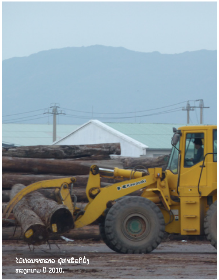
ໄມ້ທ່ອນຈາກລາວ ຢູ່ທ່າເຮືອກິຢັງ ຫວຽດນາມ ປີ 2010.

ບັນດາບໍລິສັດຫວຽດນາມທີ່ຄ້າໄມ້ທ່ອນຂອງລາວຍັງຈັດສົ່ງໃຫ້ຜູ້ຊື້ຄົນຕ່າງປະເທດແລະຜູ້ທີ່ເຮັດໄມ້ແປຮູບຢູ່ພາຍໃນປະເທດນໍາ. ຕົວຢ່າງບໍລິສັດໄນສ໌ວູດທີ່ຕັ້ງຢູ່ຮ່າໂນ້ຍໄດ້ຈັດສົ່ງໄມ້ທ່ອນຂອງລາວໄປອິນເດຍແລະຈີນ. ການຊອກຄົ້ນທາງອິນເຕີເນັດເປີດເຜີຍໃຫ້ຮູ້ວ່າ ມີການຄ້າໄມ້ລາວລະຫວ່າງປະເທດຢ່າງຫລວງຫລາຍ ຕົວຢ່າງໃນປີ 2010 ບໍລິສັດຫວຽດ ອັນ ວູດຈໍາກັດ ຂອງຫວຽດນາມ Viet Anh Wood Co Ltd ໄດ້ສົ່ງທັງໄມ້ທ່ອນ (yellow balau) ແລະໄມ້ (keruing) ຈາກປະເທດລາວອອກຂາຍໄປຕ່າງປະເທດເດືອນລະ 20,000 ແມັດກ້ອນ. ບັນດາຜູ້ຄ້າຈາກປະເທດອາຊີອື່ນໆທັງຫລາຍຕ່າງກໍພາກັນລໍາລວຍຈາກປ່າໄມ້ຂອງປະເທດລາວ ເປັນຕົ້ນແມ່ນບໍລິສັດສິງກະໂປ, ອິນເດຍແລະຈີນກໍຍັງກ່ຽວຂ້ອງກັບການຄ້າໄມ້ທ່ອນຂອງລາວ.