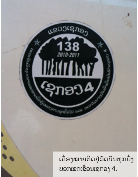
ເຄື່ອງໝາຍຕິດຢູ່ລິດບັນທຸກປົ່ງບອກເຂດເຂື່ອນເຊກອງ 4.

ລຸ່ກ່າຍອະທິບາຍວ່າທຸລະກິດການສົ່ງໄມ້ທ່ອນອອກໄປຫວຽດນາມຂອງພອນສັກຈະມີຄວາມສໍາຄັນກວ່າທຸລະກິດປຸງແຕ່ງໄມ້ ເພາະວ່າພອນສັກ ຜູ້ເປັນເຈົ້າຂອງຈະໄດ້ກໍາໄລເປັນເງິນສິດຢ່າງໄວວາ. ລາວເປີດເຜີຍວ່າພອນສັກໄດ້ເງິນຫລາຍຈາກການສົ່ງໄມ້ທ່ອນອອກໄປຫວຽດນາມ ເມື່ອທຽບກັບກໍາໄລທີ່ໄດ້ຮັບຈາກໂຮງງານໄມ້ປຸງພື້ນປາກເກ່.