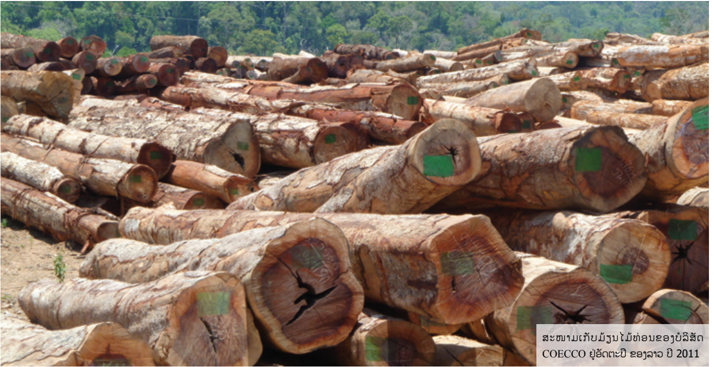
ສະໜາມເກັບມ້ຽນໄມ້ທ່ອນຂອງບໍລິສັດ COECCO ຢູ່ອິດຕະປື ຂອງລາວ ປີ 2011