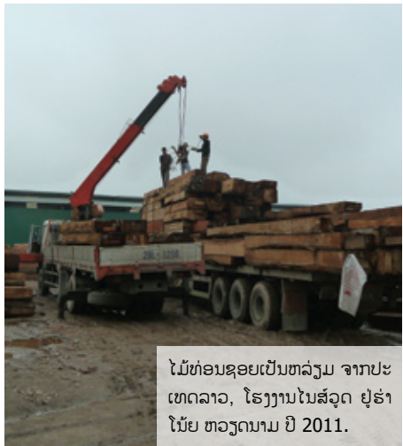
ໄມ້ທ່ອນຊອຍເປັນຫລ່ຽມ ຈາກປະເທດລາວ, ໂຮງງານໄນສ໌ວຸດ ຢູ່ຮ່າໂນ້ຍ ຫວຽດນາມ ປີ 2011.