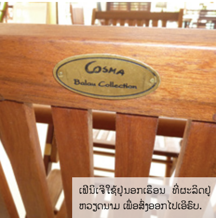
ເຟີນີເຈີໃຊ້ຢູ່ນອກເຮືອນ ທີ່ຜະລິດຢູ່ຫວຽດນາມ ເພື່ອສົ່ງອອກໄປເອີຣົບ.