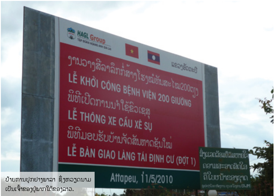
ປ້າຍການປູກຢາງພາລາ ຊຶ່ງຫວຽດນາມ ເປັນເຈົ້າຂອງຢາງພາກໃຕ້ຂອງລາວ.

ເລື່ອງນີ້ຍັງສະທ້ອນໃຫ້ເຫັນຢູ່ໃນການຍື່ນຄຳ ຮ້ອງຂອງຫວຽດນາມ ເພື່ອຂໍທຶນຈາກທະນາ ຄານໂລກ ພາຍໃຕ້ນະໂຍບາຍລິເລີ່ມຊື່ວ່າ ການ ຫລຸດຜ່ອນການປ່ອຍອາຍແກັສເຮືອນແກ້ວ ຈາກການຕັດໄມ້ທຳລາຍປ່າແລະການເຮັດໃຫ້ ປ່າເສື່ອມໂຊມ (REDD). ຄຳຮ້ອງນີ້ບອກວ່າ “ບໍ່ຈຳເປັນຕ້ອງມີສິ່ງພິສູດເຖິງແຫລ່ງທີ່ມາຂອງ ຊະນິດໄມ້ທີ່ນຳເຂົ້າມາ ເພາະມີແຕ່ໄມ້ທີ່ລະບຸ ໄວ້ຢູ່ໃນລາຍການ (CITIES). ເລື່ອງຈຶ່ງນຳໄປ ສູ່ບັນຫາທີ່ວ່າໄມ້ທີ່ນຳເຂົ້າມານັ້ນເປັນໄມ້ທີ່ຖືກ ກົດໝາຍ ເຖິງວ່າມັນຈະຖືກສົ່ງອອກຈາກບ່ອນ ໃດບ່ອນໜຶ່ງຢ່າງຜິດກົດໝາຍກໍຕາມ ໂດຍສະ ເພາະສິ່ງອອກຈາກລາວແລະກຳປູເຈຍ ຊຶ່ງເປັນ ບ່ອນທີ່ມີການເກືອດຫ້າມສົ່ງໄມ້ທ່ອນແລະໄມ້ ຊອຍອອກອາກປະເທດ”. 39