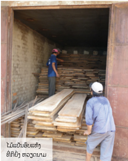
ໄມ້ແປ້ນອົບແຫ້ງ ທີ່ກີຍິງ ຫວຽດນາມ