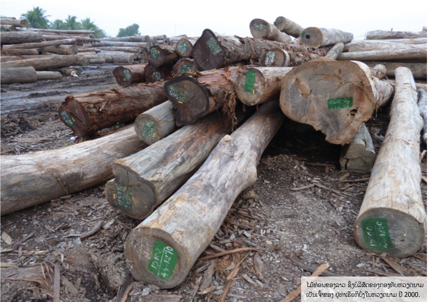
ໄມ້ທ່ອນຂອງລາວ ຊຶ່ງບໍລິສັດຂອງກອງທັບຫວຽດນາມ ເປັນເຈົ້າຂອງ ຢູ່ທ່າເຮືອກີຍິ່ງໃນຫວຽດນາມ ປີ 2000.