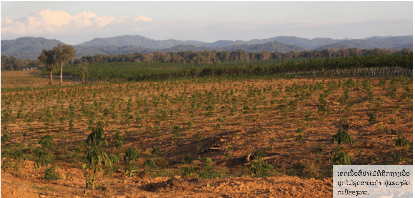
ເຂດເນື້ອທີ່ປ່າໄມ້ທີ່ຖືກຖາງເພື່ອປູກໄມ້ອຸດສາຫະກໍາ ຢູ່ແຂວງອັດຕະປືຂອງລາວ.