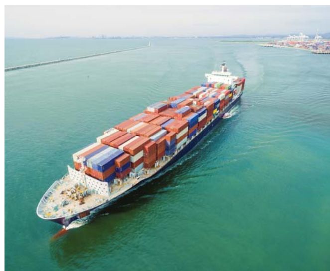
Sopra: Le differenze di valore tra le dichiarazioni di esportazione e le fatture non possono essere spiegate solo con i costi di spedizione aggiuntivi.

mentre la MCT evitata per lo stesso anno è di quasi di 14,8 milioni di dollari.