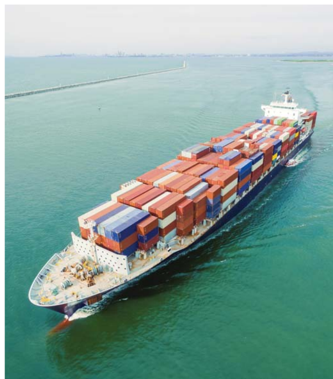
Boven: De verschillen in waarde tussen de exportaanblijven en de facturen konden niet alleen door de extra verzendkosten worden verklaard.

Wanneer we dit probleem over een langere periode bekijken, waarvoor volledige handelsgegevens nodig zijn, blijkt dat dit probleem al enkele jaren bestaat (tabel 3).