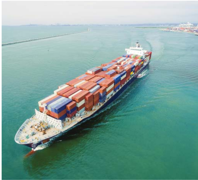
Iznad: Razlike u vrijednosti između izvoznih deklaracija i faktura ne mogu se opravdati samo dodatnim troškovima dostave.

Hrvatsku. Nepodudaranja na svjetskoj razini za 2019. godinu prikazuju se u tablici 2. Kada je riječ o utajenom porezu (SGT), ova razlika iznosi gotovo 6 milijuna USD, dok je utajeni MCT za istu godinu gotovo 14,8 milijuna USD.