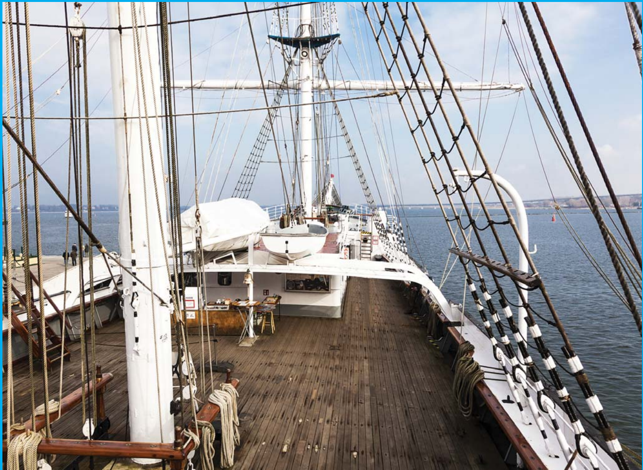
Boven: Het Gorch Fock -Tallship van de Duitse marine.

In 2019 kreeg het EIA extra verzamelingen van scheepsdocumenten die betrekking lijken te hebben op naar schatting 10 ladingen teakhout die bestemd zijn voor de renovatie van de Gorch Fock , een zeer belangrijk schip van de Duitse marine.